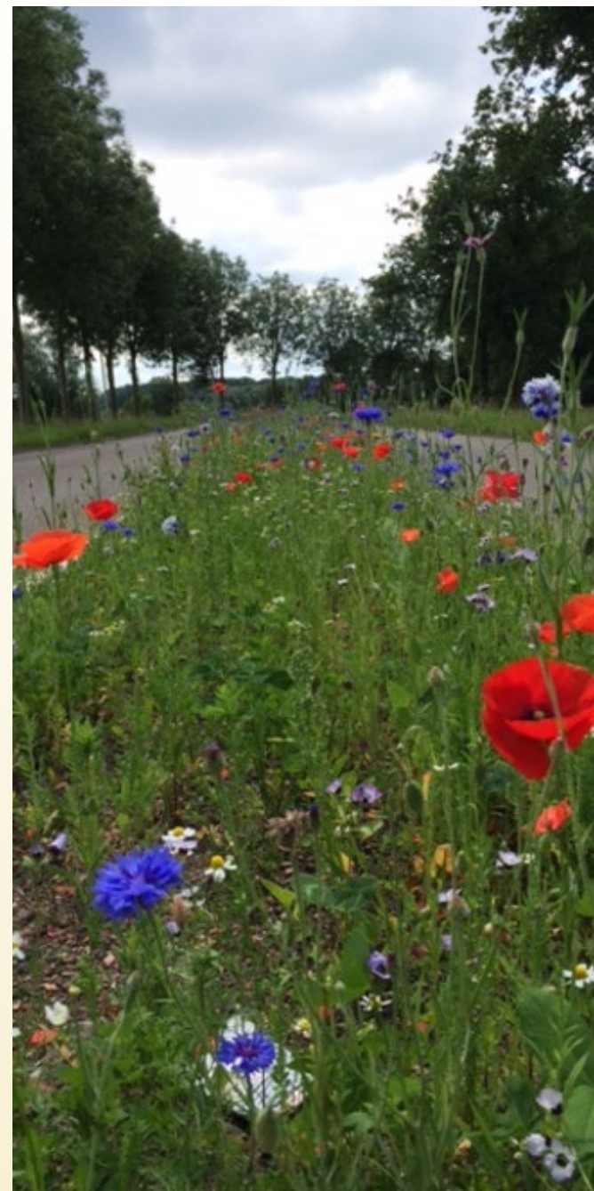
Bloeiende berm in Hedel, gemeente Maasdriel

“Bee Deals brengt niet enkel het positieve voor de leefomgeving van de bij mee. Onze inwoners worden ook positief over de veranderingen in de openbare ruimte. Meer bloei, meer kleur wat positief is voor onze leefomgeving en gezondheid van onze inwoners.”